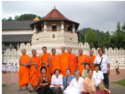
มหาวิหารพระเขี้ยวแก้ว : แคนดี้ 2550