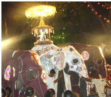
พิธีแห่พระเขี้ยวแก้ว ยิ่งใหญ่อลังการ