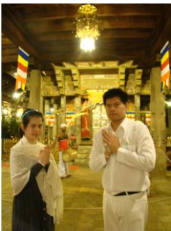
วิหารพระเขี้ยวแก้ว 2554