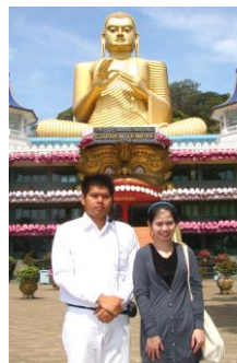
วัดทองคำ : คัมบลละ