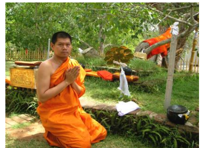
ต้นพระศรีมหาโพธิ์ : อนุราชปุระ 2551