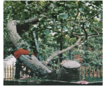
ต้นพระศรีมหาโพธิ์ กิ่งเดิมจากพุทธคยา พระนางสังฆมิตตาเดวีนำผู้ศรีลังกา พ.ศ.236